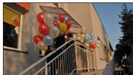
Otwarcie biblioteki Gminnej w Perzowie czytaj na stronie 3 >>