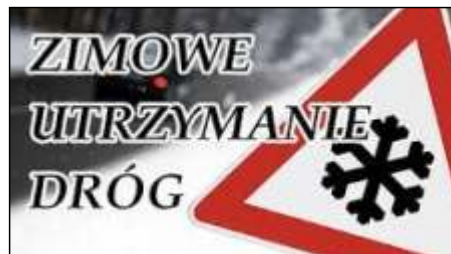
Zimowe utrzymanie dróg czytaj na stronie 11 >>