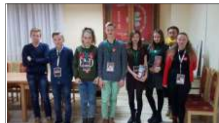
Final WO P w Gminie Perzów czytaj na stronie 4 >>