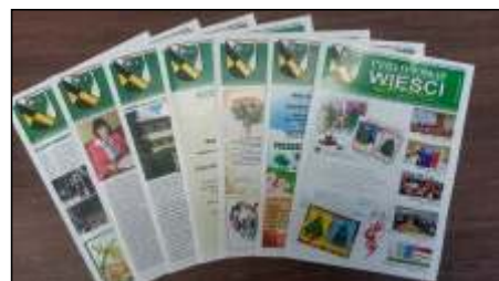
Podsumowanie roku 2016 czytaj na stronie 5 >>